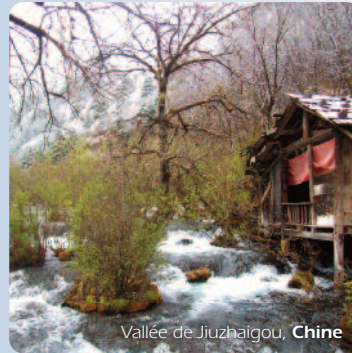
Vallée de Jiuzhaigou, Chine