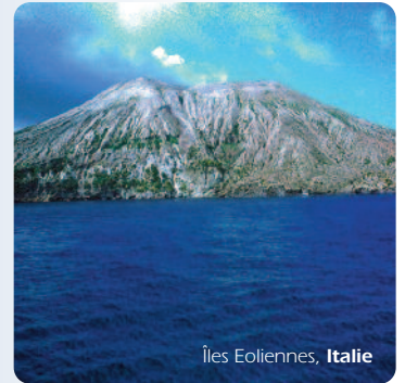
Îles Eoliennes, Italie