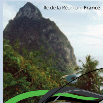
Île de la Réunion, France