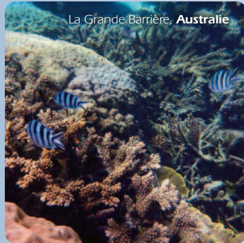
La Grande Barrière, Australie