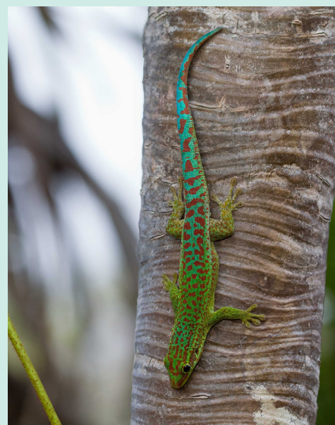
Forêt de Bebour